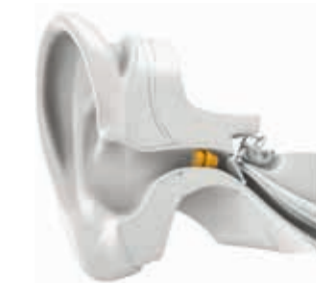
Positionnement de Lyric dans votre conduit auditif

Invisible et incroyable, mieux entendre commence par un rendez-vous dans notre centre agréé Lyric Lyric capte et amplifie le son différemment d'un appareil auditif traditionnel, pour que vous ne passiez jamais à côté du bruit de la pluie sur les toits, du rire de vos petits-enfants ou du bruissement des feuilles dans le vent. Il est placé dans le conduit auditif, là où le son est capté, afin de restaurer le son de la manière la plus naturelle possible.